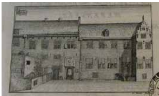
2. kép. Páldi Székely István rézmetszete az utrechti főiskoláról (Utrecht, 1747)

arcképét ismerte tőle. 6 Korábban is ismert volt, hogy leideni tanulmányait 1751-ben már Utrechtben folytatta.