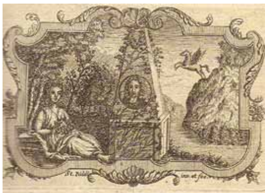
3. kép. Páldi Székely István rézmetszete: allegorikus jelvény (Utrecht, 1748)

A két címlapon található metszet egyike az utrechti főiskolát ábrázolja (1747), 7 a másik allegorikus jelvény (1748) 8 . Az előbbi nyomdája az utrechti Hermann és Johann Besseling, a másiké Henric Spruit.