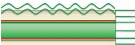
1. ábra. Standard védőréteg

A folyamatos fejlesztéseknek köszönhetően a Lohmann az elsők között kapta meg az ESKO-Artwork minősített beszállító tanúsítványát.