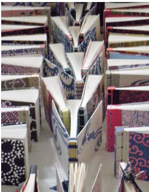
A 2011. tanév végi kiállítás fotója

eszközöket ismerik, alkalmazzák a precíz, tervezői kivitelezéshez. Tehát a műszaki rajzlapon az ábrázoló geometria eszközeit, úgymint vonalzókat, csőtollat, pauszpapírt használnak szakszerűen. Az egyszerű kompozíciós gyakorlati lapokat tussal, fekete-fehérben, majd színes papírapplikációban készítik el. Betűanatómiai alapok, monogramtervezés, grafikai kivitelezés, majd egy-egy szabadon választott „mese” iniciálé készítése az elsőéves feladatsor. Amit természetesen a tanév végén rendezett kiállításunkon be is mutatnak.