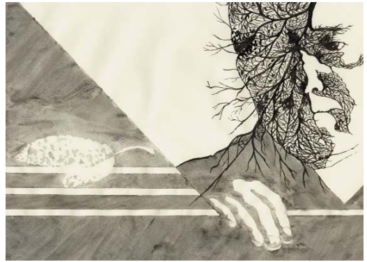
Kovács Vörös Réka: Lengyel Lajos-parafrázis

B. S.: A záróévben tételenként kidolgozzák és átveszik az írás-, könyv-, tipográfia- és nyomdászattörténet korszakait, jellemző stílusjegyeikkel,