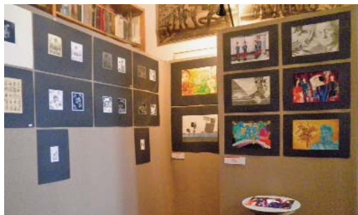
A 2011. tanév végi kiállítás fotója

T. Y. Zs.: A szakunkon tanuló 9. osztályos diákok grafikai alapozó feladatokkal kezdik a könyvműves képzésüket. Manuálisan készített grafikai feladatlapokon, vonal és kör ritmusgyakorlatokon, fegyelmező gyakorlatsorozatokon a tervezőművészetben már régóta ismert