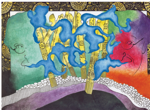
Szalay Cynhtia: Jaschik Álmos-parafrázis

centenáriumra készítettek el több könyv- és illusztrációs tervet, más néven „parafrázist”. De Kassák Lajos, Lengyel Lajos, Moholy-Nagy László műveit is már több alkalommal feldolgozták, újra „felfedezték” az érettebb gondolkodású könyvszakos tanulók.