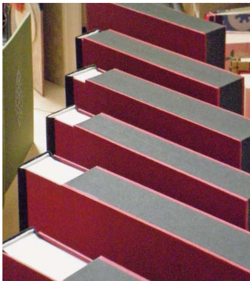
A 2011. tanév végi kiállítás fotója

sok gondoskodó édesanya és apuka szemében látom felcsillanni a „reményt”, hogy hátha az ő szemefénye, a drága kis fiókája talán éppen ezt a szakot választja, és az itt látott, bemutatott tizenkét művészeti szakképzés közül majd „könyves” lesz. Persze, nehéz a csemetéknek a felvételinkre felkészülni. Nehéz az alkalmassági, felvételi vizsgát sikeresen teljesíteni, majd éppen