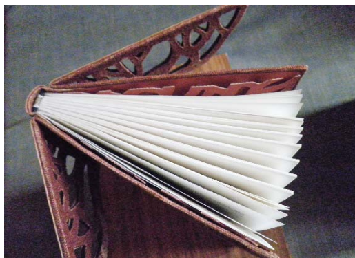
A 2011. tanév végi kiállítás fotója

A rézkarc, mélynyomás egyéb technikáit is megismerik, úgymint például az „akvatintát”. Aztán a magasnyomás technikájához ecsetrajzzal gyakorlati lapokon, tussal, fekete-fehérben, majd a „mintarajzok” alapján egy-egy linómetsetet készítenek el. Betűanatómiai ismereteiket szélesítve könyvborítót, védőborítót terveznek, illusztrálnak, és az egy-egy szabadon választott könyv „arcát” „tipografizálják”. Több esetben festék- és fólianyomás technikájával, kézi szedéssel vagy klisényomtatással. Természetesen a másodikéves feladatsor is az év végi kiállításon kerül bemutatásra.