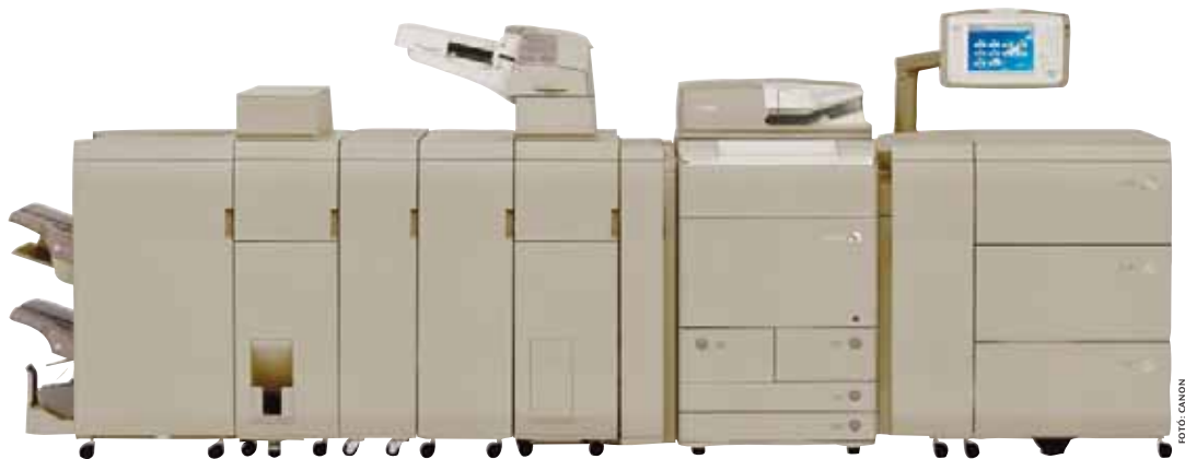
Canon imageRUNNER ADVANCE C9070 PRO-v10

kal vagy megszüntette nyomdai tevékenységét. A vizsgálat végső elemzését 2010 májusában teszik közzé.