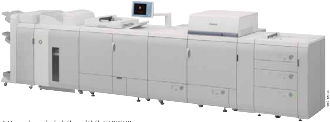
A Canon-berendezések élvonalából: C6000VP

Az előző IpeX jelentős mérföldkő volt a Canon életében, már itt is egyértelmű volt az imagePRESS termékcsalád bevezetésével, hogy a Canon teljes mértékben elkötelezte magát a nyomdaipar mellett. A számok magukért beszélnek: mára több mint ezer imagePRESS berendezést helyeztek üzembe, amivel több mint százmillió nyomtatás készül havonta, és a bevezetés óta összesen csaknem kétmilliárd nyomtatást adtak el a Canon partnerei.