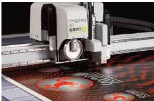
Kongsberg XL20 — sokoldalú ígásló mintadobozok elkészítéséhez, kis sorozatú gyártáshoz

termékek kis sorozatú gyártására és a display iparág merev anyagainak feldolgozására készült. Ugyanakkor a Kongsberg-berendezések számos technológia és anyag feldolgozására ideális megoldást kínálhatnak, mint: