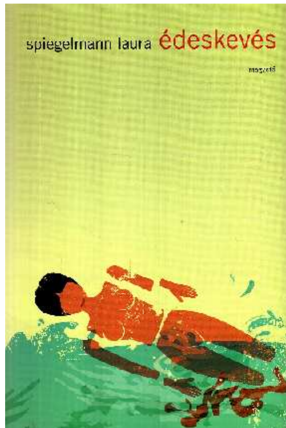
6. ábra Spiegelmann Laura Édeskevés, Magvető (2008)

visszajeléseket kapjanak gondolataikról, így a két terület tipográfiai megfelelései nem feltétlenül vannak maguk után tartalmi/értékbeli azonosságokat.