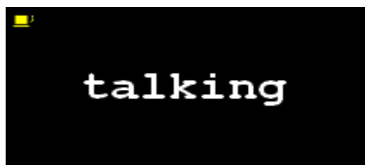
3. ábra Barbic animációjának egy képkockája

Az oldalom megjelenő egyéb szöveges részek is visszafogottak, a legnagyobb feltűnést egy 15 képkockás animáció kelti (3.kép), amelyen egyszerű sanserif, fehér színű, félkövér, 16-os betűmérettel íródott angol szavak váltják egymást (cheating, loving, fighting, fucking, drinking, talking, losing, loughing, crying, dreaming, riding, drinking, breathing, winning, kissing). A megoldás nagyon hatásos és tipográfiaailag is figyelemre méltó, hiszen az egyforma külalakú szavak az egységességet, egységességet képviselik, ám az egyszerű animáció teljesen új jelentésréteggel ruházza fel őket, egy olyan dinamikus, teljes élet metaforái lesznek, amit Barbic –bevallása szerint– él, mi pedig joggal irigyelhetjük tőle.