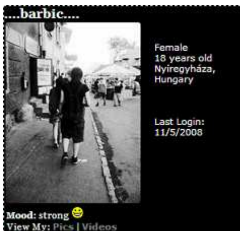
2. ábra Myspaces „személyi igazolvány”

A myspace viszont a korlátlan kreativitás világa. Hogy Microsoft szabványú betűtípust, betűformát és méretet varázsolhat a képernyőre a felhasználó, annak csak kreativitása és szépérzéke szabhat határt. Az élmény kiegészíti a saját space-hez tetszőlegesen hozzárendelhető zene, a végtelen számú beszűrhető kép.