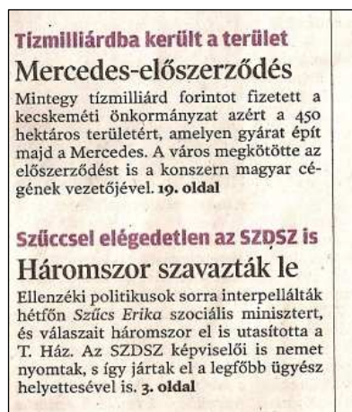
6. kép. Címelek.

A cikkeket egymástól elkülönítő függőleges léniaiák változatlanok, a vízszintes léniaiák viszont szürke színt kaptak és 1,5 pont vastagságúak lettek. Ezek mellett előfordulnak szaggatott vonalból álló léniaiák függőlegesen és vízszintesen is. Jellemző az újságban megtalálható cikkeket elválasztó léniaiákra, hogy az adott cikk két szélső hasábjáig tartanak, vagyis a cikkek melletti hasábközre már nem terjednek ki. Ezen kívül található még léniaiákat a szerző nevével, valamint a hosszabb cikkek bevezetői fölött. A szerző nevét az adott cikk végéről áthelyezték az elejére, félkövérrel szedett és balra igazított lett, valamint alulról és felülről a függőleges léniaiákkal megvező vastagságú, valamint szintén fekete lénia veszi körül.