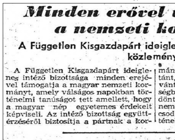
3. kép. Példa a címek változatosságára.

A címek betűméreteinek nagysága a cikkek hosszúságával arányosan nő. Kurzív címek is előfordulnak alcímeknél és főcímeknél egyaránt.