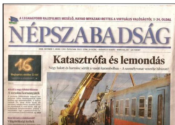
5. kép. A Népszabadság 2008. október 7-i száma.

A lap továbbra is A/3-as méretű. 6 hasábos szerkezetű és immár teljes egészében színes. Ez azt jelenti, hogy színesek a képek, az elválasztó- és díszítőelemek, valamint egyes kiemelések.