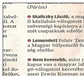
8. kép. Bekezdések.

A címoldal fejlécét alulról és felülről vékony, fekete, 0,5 pontos linea veszi körül. Megtalálható benne az újság címe, a cím aláhúzása alatt pedig lila színű, pont jellegű díszítőelemmel elválasztva, a dátum, az évfolyamszámozás. Az oldalszám, hogy budapesti vagy vidéki kiadás-e, a Népszabadság Internetes címe, valamint az újság ára. A fejléc bal felső sarkában a magyar zászlót és az Európai Unió zászlaját ábrázoló kép van. Az újság többi oldalán található fejlécben 2 részes. A felső részt egy vékony vonal választja el alulról. Itt szerepel baloldalon versallal szedett keskeny lineáris betűkkel az újság online címe, jobboldalon a Népszabadság felirat és a dátum. Az alsó részben jobb oldalon félkövér, 18 pontos szürke lináris antikvákkal az adott rovat címe, valamint a már ismert lila választó dísszel az oldalszám. (7. kép) A fejlécet 1,5 pontos, fekete linea határolja alulról.