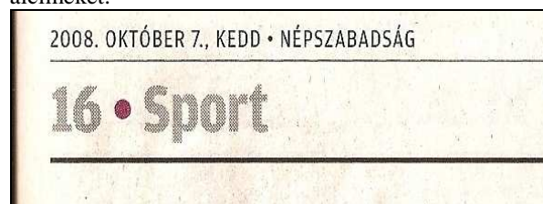
7. kép. Fejléc.

Az újság szövegbetűje is megváltozott, már ugyanazzal a betűtípussal szedik mint a címeiket és az alcímeiket.