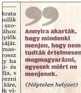
9. kép. A kiemelés új módszere.

A kiemelés még mindig kurziválással történik, de előfordul a tabloidokra jellemző módszer is. Ez azt jeleníti, hogy a szövegből egyes mondatokat kiemelve, azokat a cikken kívülre helyezik, többnyire nagyobb méretű, színes betűkkel. A Népszabadság 12 pontos lila betűket alkalmaz ehhez a módszerhez. (9. kép) A kiemelt szöveg elején 4 sor nagyságú, szürke idézőjel képe található.