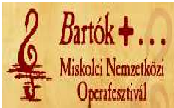
1.kép. Egy fesztivál belépőjegye.

Ezen egyleveles nyomtatványokon belül a jegy