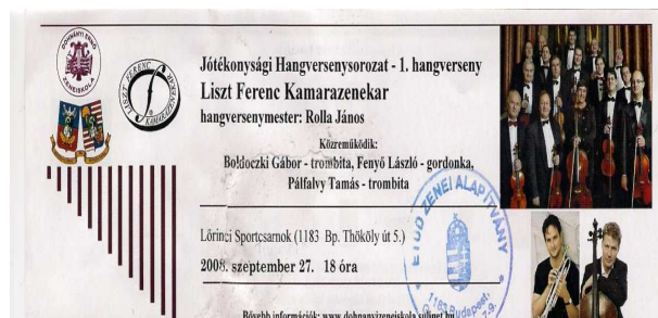
4. kép. Egy jótékonyági koncertsorozat kincertjegye.

Hosszabb, jobboldali sávon belüli közös jellemzők: fekete betűszín, s Times New Roman betűtípus, mely talpas, s enyhe kontraszttal