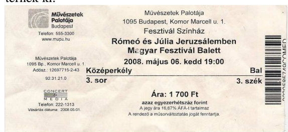
2. kép. A Művészetek Palotája koncertjegye.

Ezen különböző típusú jegyek tipográfiája csekély eltérést mutat, de az alapséma többnyire mindig ugyanaz. Nagyobb eltérés csak a magánjellegű jegyek esetében lehet, de ezekre nem térnék ki.