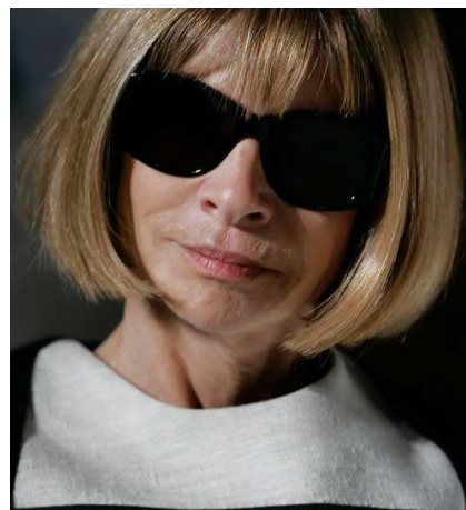
4. kép. Anna Wintour

A Times erről a fajta befolyásól a következőket írta „megkérdőjelezhetetlen a hatása az amerikai divatvilág felett. Divatbemutató addig nem indulhat, amíg ő meg nem érkezik. A tervezők sikeressé válnak, miután ő megnézte őket. A trendek az ő ízlésének megfelelően kreálódnak vagy éppen vesznek a homályba.” ( The New York Times 2006)