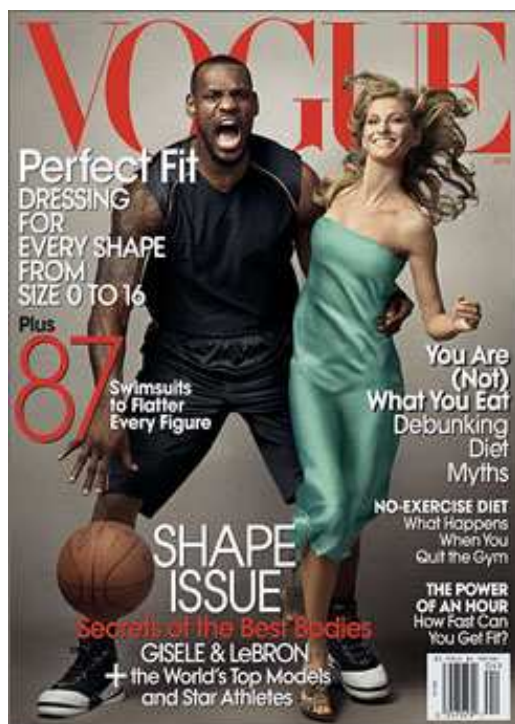
5. kép. Giselle Bündchen és LeBron James . 2008. ápr.

2008 áprilisában a Vogue egy különleges fotósorozatot alkotott Annie Leibowitz fotós, LeBron James kosárlabdázó és Giselle Bündchen