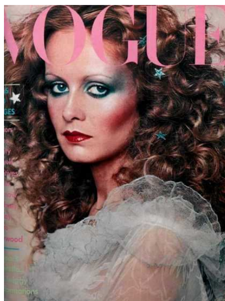
2. kép. Twiggy a Vogue Magazine címlapján. 1974.dec.

A Vogue sorozatban közölt le újabb és újabb képeket, addig ismeretlen modellekkel, akik azóta is meghatározó ikonjai a divatvilágnak. Közéjük tartozik Suzie Parker , Twiggy (2.kép) vagy éppen Veruschka .