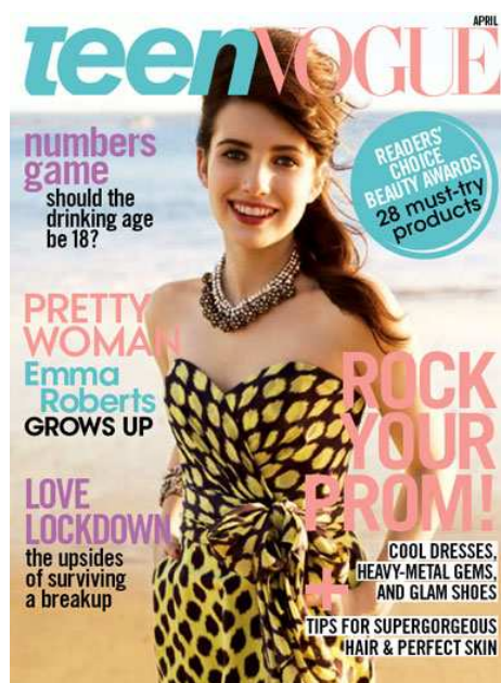
8. kép. A Teen Vogue címlapja 2009. április

Címlapján általában jól ismert, fiatal tinisztárok tűnnek fel. Ők általában lányok, de volt már példa arra is, hogy az éppen aktuális szivtíprőjelenet meg a címlapon. Ilyen volt például Zac Efron , Taylor Lautner , Daniel Radcliffe és a Jonas Brothers által fedett kiadás.