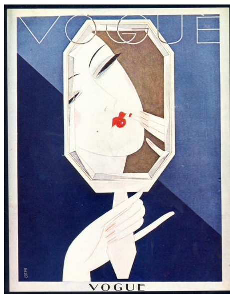
6. kép. Vogue címlap 1926..

A Vogue Magazine alapkonceptiója mindig is egy női ideálkép követése, a tökéletesen sikkes, egészséges és tájkozott nő megteremtése volt. A kezdetekben még az unatkozó, felsőközéposztály és az elit nőtagjait tudhatta híveinek. A 19.században és a 20.század elején a Vogue (6. kép) azoknak szólt, akiknek a divaton kívül más elfoglaltsága nem volt, természetesen az adománygyűjtéseken és a legfrissebb, megjelent regények megvitatásán kívül. (Delis 2007)