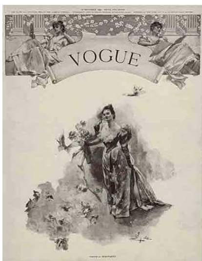
1. kép. A Vogue Magazine első borítója 1892. dec. 17

A Vogue eladási statisztikái drámaian növekedni kezdett. Még a Világgazdasági Válság és a II. Világháború során is biztos pozícióját magáénak tudhatta a lapok között.