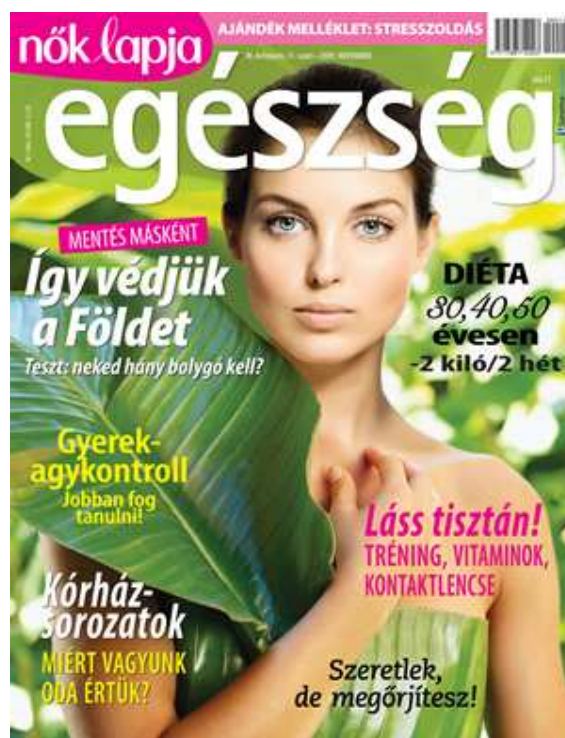
5. kép: A Nők Lapja Egészség egyik 2004-es száma