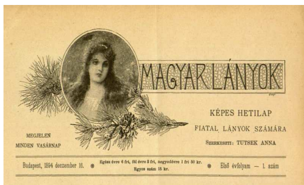
1. kép: A Magyar Lányok fejléce

Az 1894-ben induló Magyar Lányok nevű lap (1. kép) célközönsége a tizenéves, fiatal lányok voltak, akiket a lap hasábjain tanácsokkal láttak el az illendő viselkedéssel, a testápolással és a háztartással kapcsolatban, emellett érdekes, izgalmas, de tanulságos olvasmányokat közöltek.