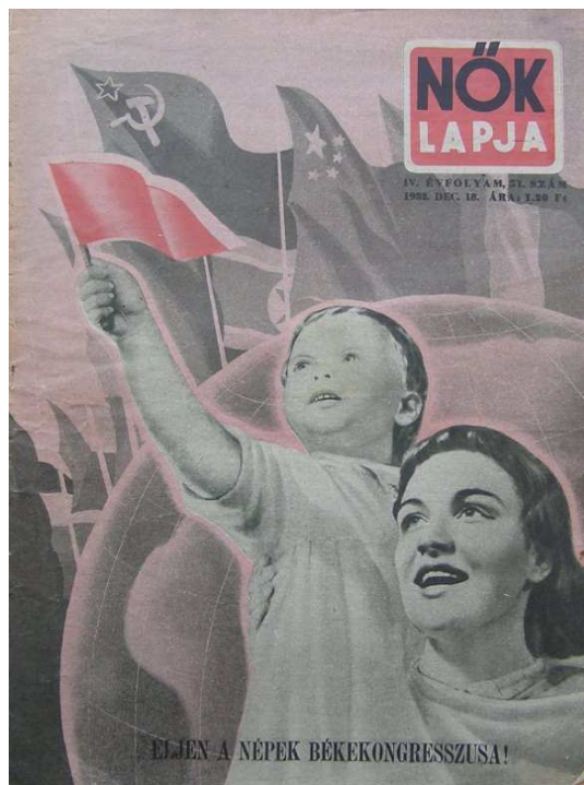
2. kép: A Nők Lapja egyik 1952-es kiadása

1952 és 1959 között a kommunisták növelték a befolyásukat a lapban: a pártideológiához és a Szovjetunióhoz hű párttagokból álló szerkesztőbizottságot állítottak az újság élére. 1956. október 18-a és 1957. január 31-e között nem