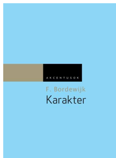
4. kép A Gondolat Kiadó Akcentusok-sorozatának két további tagja