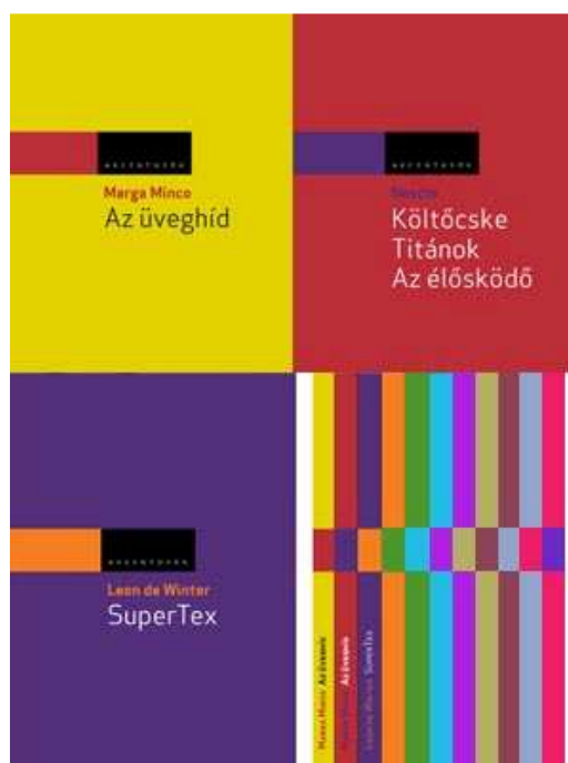
1. kép. A Gondolat Kiadó Akcentusok kortárs szépirodalmi sorozata.