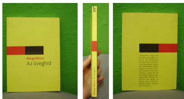
2. kép Marga Minco: Az üveghíd (Gondolat Kiadó, Akcentusok sorozat)

Összegezve úgy tűnik, hogy Máthé Hanga jelen könyvsorozat tervezésekor egy tiszta, átgondolt koncepciót valósított meg, minimalista-konceptualista megoldásokat alkalmazott, mely irány a korábbi munkáiban is megfigyelhető (3. kép).