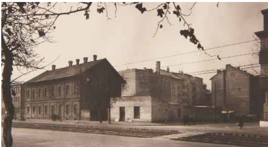
A Wörner-gyár maradványai 1950 körül

a Monarchia országain kívül a kontinens számos más országába exportálták.