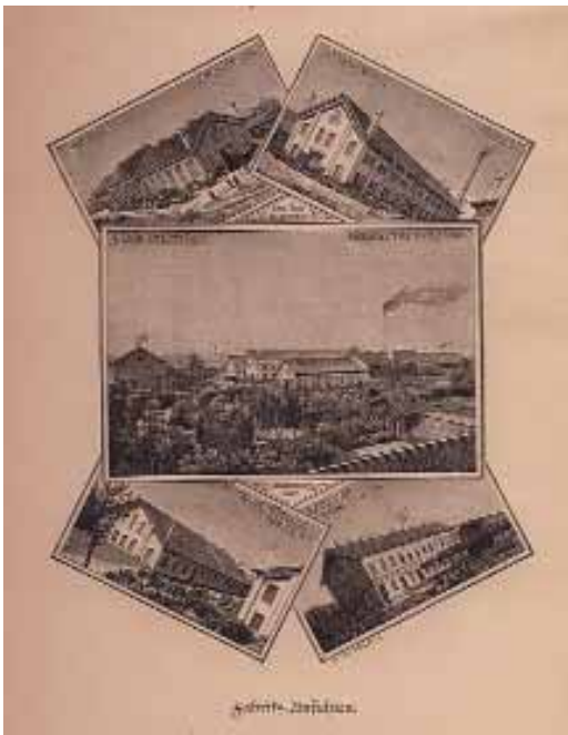
A Wörner-gépgyár 1896-ban