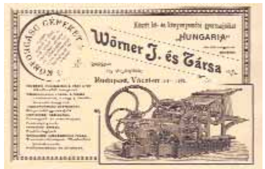
Hirdetés a Magyar Könyvnyomdászat c. folyóirat 1898-as évfolyamából

építészeti- és gépjavító vállalkozást. A Nyugati pályaudvar közelében egy megszűnt cukorgyárban lakatos-, vasesztergályos- és kovácsműhelyt létesítettek, amely ekkor mintegy 60-80 munkással főleg malomgépészeti berendezések és eszközök előállításával, malmok felszerelésével foglalkozott. Elsőként daratsztító gépét szabadalmaztatta, amit számos más malmászati gép és eszköz követett.