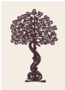
Kiadás éve: 2004; mérete: B5; terjedelme: 260 oldal; kötés: cérnafűzött, keménytábla, papírkötés Ára: 3200 Ft

A kötet a szélesebb olvasóközönség használatára szánt, 17–18. századi irodalmi szövegek és a sokszorosított grafika összefüggéseit vizsgálja. A tárgyalt műfajok, kifejezésformák és kiadványtípusok közé tartoznak az emblematika, a mirákulumos könyvek, a társulati kiadványok, a prédikáció, a meditáció, a vallásos ponyvairodalom és a szentéletrajz. Az elemzett grafikai használati formák az illusztráció, az illusztrációsorozat, az emblémakép, a címlapelőzők, a díszcímlap, a címlapdísz, a kis szentkép és az egylapos fametszet. A grafikátörténeti kutatások középpontjában a különféle képi közvetítési és transzformációs folyamatok, a kép–szöveg viszony változatai állnak.