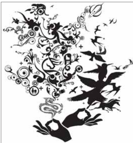
Az Elektroproduct Nyomdában, a MAP papírára készült Mérete: B4; terjedelme: 220 oldal 4+4C; ára: 6500 Ft A könyv megrendelhető a kiadótól, www.enter98.hu