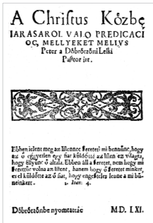
2. ábra. Krisztus közbenjárásáról való prédikációk

„A legelső debreceni nyomású könyv címlapja, 1561. Huszár Gál nyomása. Középen a bázeli Frobenius-nyomda jelvényének utánzata. 3 (Az erdélyi múzeum könyvtárának unikuma.)