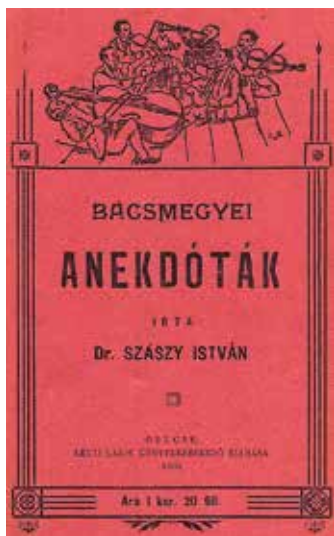
Az első helyi nyomdász kiadványa 1910-ből