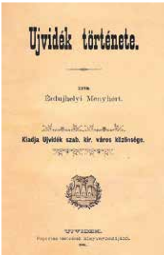
Helytörténeti munka 1894-ből

A vármegye első és a 18. században egyedüli officináját Emanuel Jankovics hozta létre 1790-ben. 1860-ig még öt nyomdát alapítottak, melyek közül kettő vizsgált korszakunkban is működött. Az 1856–1913 között üzemelő Fuchs-féle nyomdából 16 magyar nyelvű mű ismert.