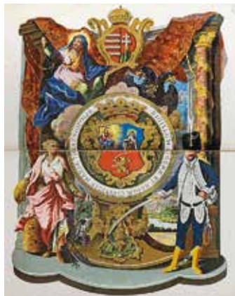
Kromolitográfia Szabadka (latinul Theresiopolis) címerével a város történeti monográfiájából (két kötetben megjelent 1886-ban és 1892-ben)

nyomdája 1897–1911 között működött. A Hungária Nyomda, elődeivel együtt, 1897–1913 között üzemelt.