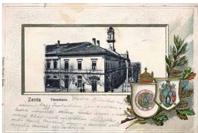
Zentai képeslap a városházával és a település címerével (1915 körül)