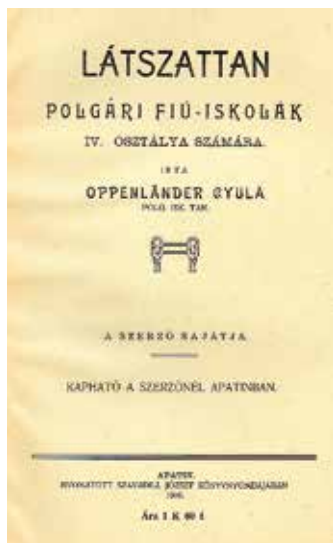
Apatini tankönyv címlapja 1910-ből

Barcsy Zsigmond 1874–1884 között működő nyomdájából egy mű ismert. Fekete (Schwartz) Sándor nyomdája 1881–1915 között üzemelt,