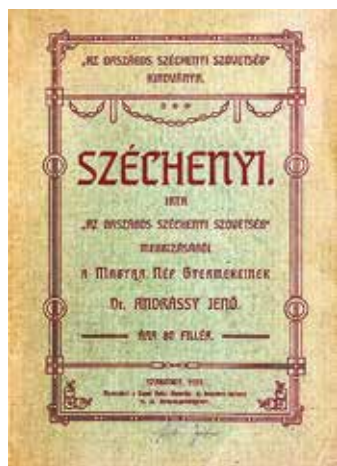
Széchenyi gyermekeknek szánt életrajza 1909-ből

Kollár József 1901–1913 között működő nyomdájának hat műve ismert. Baits Vladimir 1902–1913 közt üzemelő