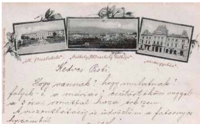
Székelyudvarhelyi képeslap (1902)