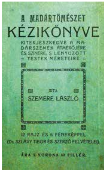
Ornitológiai mű Csíkszeredáról (1913)