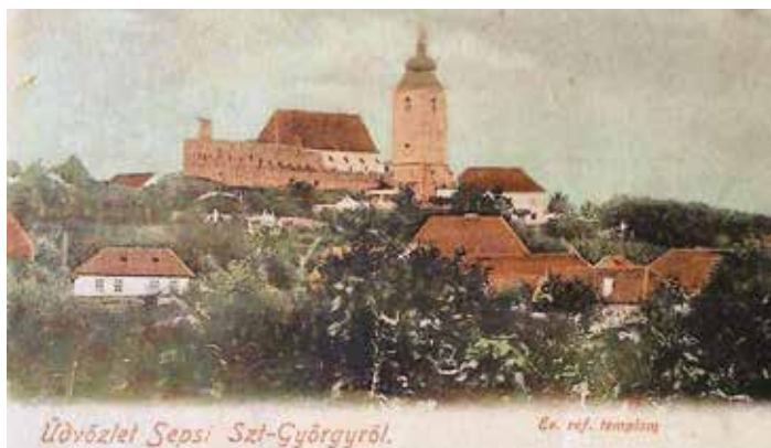
Sepsiszentgyörgyi képeslap a református templommal (1900 körül)

A helyi, 1882 óta működő Jókai Nyomda Rt. nem kevesebb, mint 106 kiadványát ismerjük az 1884 és 1918 közé eső bő három évtizedből. Ezek közül a legtöbb helyi iskolai értesítő. Emellett érdekes vonás, hogy a szerzők között számos latin eredetű álnéven publikáló akad.