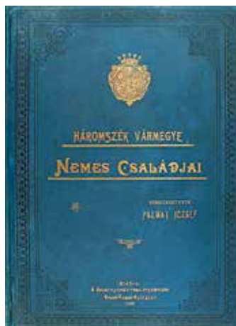
Háromszék vármegyei genealógiai mű (1901)