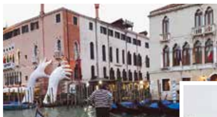
A Canal Grandéból kinyúló, a Ca'Sagredo Hotel falába markoló kezek Lorenzo Quinn: Support alkotásai. A globális felmelegedés veszélyeire hívják fel a figyelmet.

Az 57. Velencei Képzőművészeti Biennálén 86 ország vett részt, és több mint 615 ezer látogató kereste fel a helyszíneket. Magyar szempontból a legfontosabb fejlemény, hogy több évtized után újra voltak magyar meghívottjai a kiállításnak, amelyre 120 művész kapott meghívást. ... és két év múlva? Persze addig is lesznek, akik Velence kedvéért idelátogatnak.