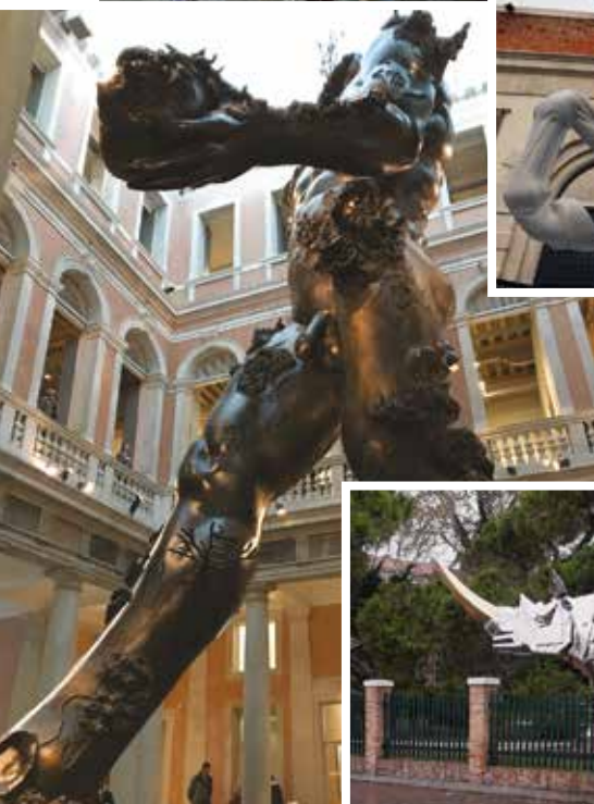
Damien Hirst: férfaktja – egészen jól felismerhető. A művész gigantikus, néha szarkasztikusnak tűnő szobrai két külön épületben kaptak helyet.