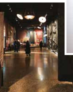
Agyagból gyúrt golyók, vagyis Archive of Mind, a nyomat hagyás rítusa a dél-koreai Kimsooja performansa – a látogatókkal közös műve.