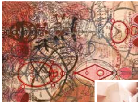
A prágai Lubos Plyn ínyenc grafikái.