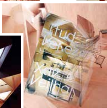
A francia pavilon zenei központjában csodálatos fa burkolat, tér és ritmus egyszerre. Xavier Veilhan, Studio Venezia – hirdeti az igényes tipográfia. Zenei élményeket kínál.