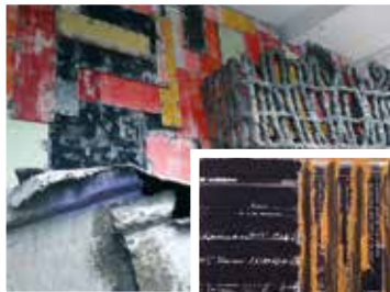
A chicagói McArthur Binion gyönyörű festményei tipográfiai kompozíciók is.