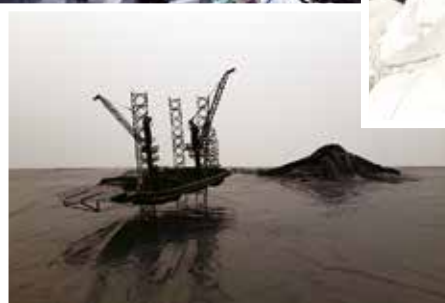
Japán egy csodás ikebana világot varázsolt a gyanútlan látogatók elé... Takahiro Iwasaki alkotása.