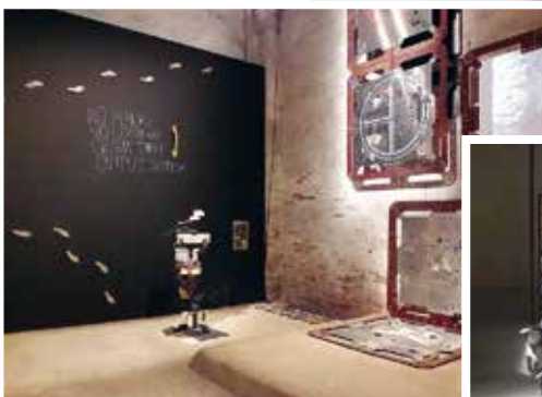
Alicjka Kwarde Weltenlinie , tükör a tükörben.