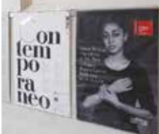
Shirin Neshat: The Home of My Eyes – digitális showja a Museo Correr antik szobrai közé költözött.