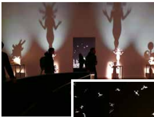
Az orosz kiállításról három képben...