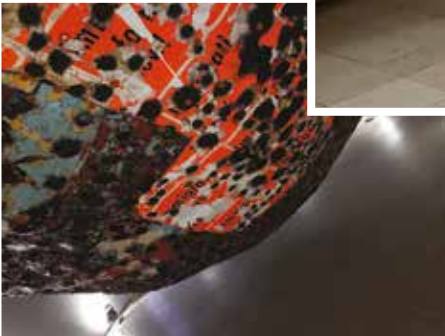
Az emberiséget mint egyre növekvő lavina fenyegeti a migráció, avagy a kommunikáció sötét gömbje... az amerikai pavilonban. Ázsia kis tigrise Korea neonfényekbe öltözött. Welcome, pole dance, free video, free narcissistic people disorder, free peep show –Take it easy–