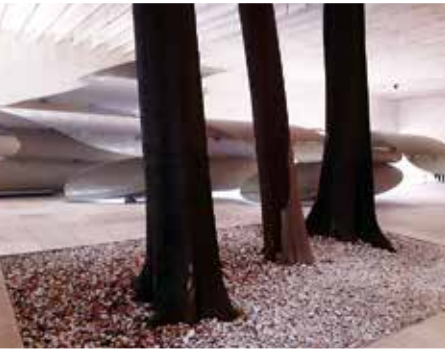
A skandinávok közös pavilonja az ember és a természet gondjaira hívja fel a figyelmet

velencei kirándulásán részt vett tanártársaimat kérdeztem: 1. Mi a véleményed a Velencei Biennáléről? (globálisan és általánosan a rendezvényről) 2. Melyik volt a legjobb, legemlékezetesebb nemzet vagy kiállító, aki maradandó élményt nyújtott? (mivel és miért) Erre a két kérdésre kértem a véleményüket. Írásban és egymástól függetlenül. Így nem csak a magam benyomásaira építve adom át ennek a szép utazásnak az emlékeit. Ahol a vélemények egybeesnek, olyan,