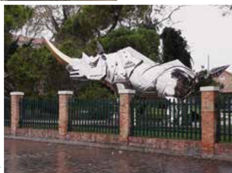
Nem Dürer, de rinocérosz.