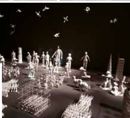
...fény-árnyék-animáció. Valamint egy applikáció: digitális szobrok röntgenképe.