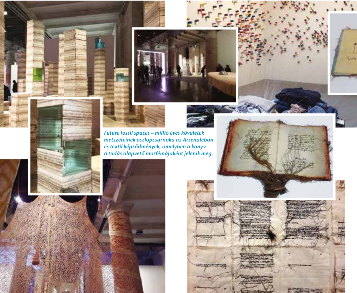
Future fossil spaces – millió éves kőületek metszeteinek oszlopcsarnoka az Arsenaleban és textil képződmények, amelyben a könyv a tudás alapvető morfójaként jelenik meg.

legalább akkora hatással állítják meg az embereket a Fülöp-szigeteki pavilon 2,5–3 méteres szurreális festményei. Vonzó és egyben félelmetes. Persze számolatlan csodálatos illusztráció, rajz és festmény, szobor fogott meg a Giardini pavilonjaiban és az Arsenale csarnoképületeiben, vagy akár sétálva a város különböző pontjain, de talán a legnagyobb hatást a Palazzo Fortuny, azaz a Fortuny Museum (gótikus épület, egyike Velence legnagyobb palotáinak), Intuition