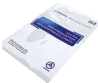
Aerzen termékkatalógus vizuális koncepciója