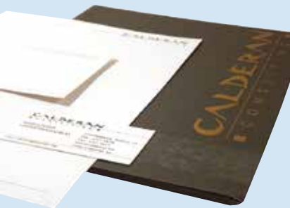
Calderan Consulting cégarculat webtervezéssel