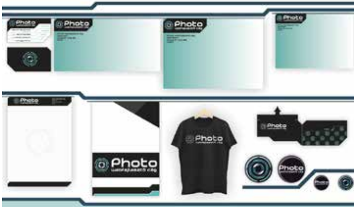
Németi Szabolcs „Photo webfejlesztő cég” arculatterve

höz fóliázott védőborítót készített szép grafikával, hangulatos betűválasztással, amely visszaköszön a könyvjelzőkön, kitűzőkön is.* Szakácsi Zsanett „Csipkerózsika” memóriakártya-játéka, kiadványterve és díszdoboz-csomagolása a 8–10 éves korosztályt célozza meg. A díszdoboz kétfiókos megoldású, a gyermek beleteheti a kis kötetet és a kártyákat, a ládikát pedig magával hurcolhatja bárhová. Tóth Emese „Veterán autók” fotóalbumát saját fotóival illusztrálta. A kompozíciós ügyesség