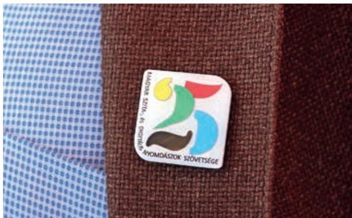
A jubileumi kitűzőt büszkén viselték a résztvevők

lás éveiről, és felhívta a figyelmet az elmúlt két évtizedben bekövetkezett digitalizáció térhódítására. Ezért a szövetség elnevezése is frissítésre szorul, mert a technológiai változások miatt sokkal inkább helytálló a szövetséget