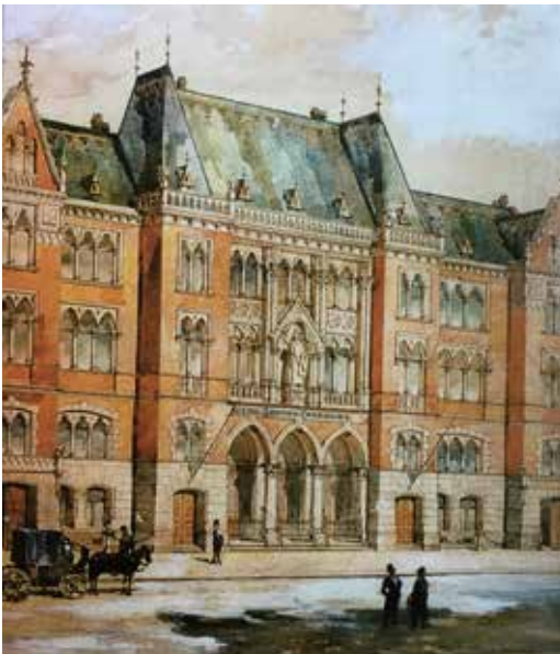
A Szent István Társulat székháza és nyomdája 1900 körül

Az építkezésnél sokkal nagyobb feladatot jelentett a nyomda berendezése. El kellett dönteniük, hogy csak a Társulat saját érdekeit kiszolgáló nyomdát szerelnek fel, mert erre volt meg az anyagi fedezetük, vagy további kölcsön felvé-