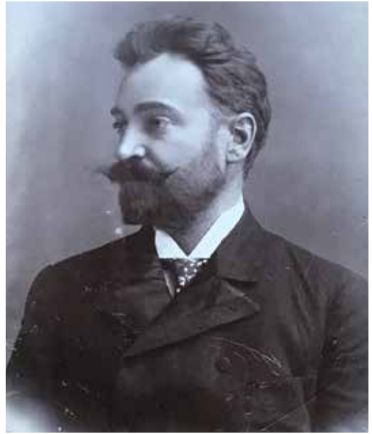
Kohl Ferenc (1859–1942)

A későbbiek során, a szomszédos Rózsa Nyomda megvásárlásával, annak nagy raktárkészletén kívül 12 régi és új nyomógéphez, értékes betűanyaghoz, kiadványok sztereotípiáihoz és egy teljesen modern, naptárnyomtatásra használt kétszínnyomó rotációsgéphez jutottak, valamint sor kerülhetett a nyomda területének növelésére is. Az építkezés során a régi nyomdai üzemrészek kiegészítésére egy háromemeletes vasbeton nyomdai épület készült. Emellett a Rózsa-ház udvara üvegfedelet kapott, így a Társulaté lett Budapest legnagyobb, legcélszerűbben felépített kiadóhivatali helyisége, amely alatt hasonló nagyságú vasbeton raktárhelyiség foglalt helyet.