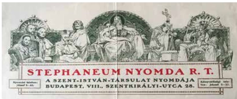
Stephaneum Nyomda levélfej

és sorjában letette a betű- és gépszedői, valamint az egyéb szükséges segéd- és mestervizsgákat. Apám – aki ugyancsak jó rajzkészségű volt – egy levelében említi, hogy hosszasan rajzoltak apjával rotációs gépeket, mert ezeken apja újabb műszaki változtatásokat kívánt bevezetni. Apám a szakmai vizgák letétele után eleinte cégvezetőként dolgozott nagyapám mellett, majd mikor nagyapám nyugdíjba ment, átvette a nyomda igazgatói beosztását és teendőit.