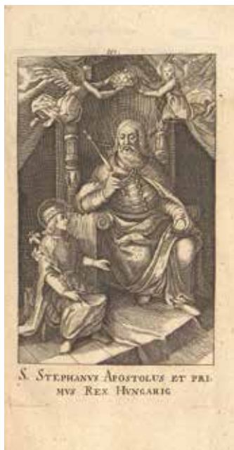
Heltai Gáspár: Magyar krónika (Szent István király)

Nyelvi megoszlásukat tekintve 509 latin, 335 magyar és 129 német nyelvű kiadványt számolhattam össze; vagyis a nyomtatványok 55%-a latin, 34%-a magyar, míg 13%-a német nyelven készült. Adott ki emellett a nyomda egy-egy horvát, illetve francia nyelvű kiadványt; míg néhány kötet több nyelven jelent meg. Ez utóbbiak legszebb példája az 1731-ben napvilágot látott Rituale Romano-Jaurinense , melyben az egyházi szertartások szövege latin, magyar és horvát nyelven egyaránt megtalálható. De említésre érdemes Márton István pápai református professzor 1794-ben megjelent, A görög nyelv első kezdete című munkája is, melyben a nyomda görög betűkészletét is megcsodálhatjuk. A nyelvi megoszlás alakulását tekintve kiemelhetjük a magyar nyelvű kiadványok látványos elő-