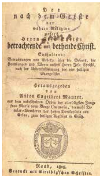
Maurer: Der nach dem Geiste der wahren Religion... (címlap)

Az alkalmi kiadványok száma és félesége tovább nőtt: a halotti búcsúztatók mellett népszerűvé válnak például a névnapki köszöntők vagy éppen a beiktatási beszédek: egy-egy győri püspök, szentmártoni főapát vagy bakonybéli apát beiktatása alkalmából nem ritkán hat-nyolc alkalmi kiadványt is megjelentetett a győri nyomda. Megjelennek továbbá a plakátok, hirdetések is: különösen 1848–1849-