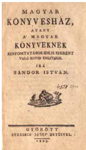
Sándor István: Magyar Könyvesház (címlap)

A 18. századi győri Streibig-kiadványok második legnagyobb csoportját „egyéb szakirodalom” néven tudnám összefoglalni. A jelentős számú jogi szakkönyvet itt és most hely hiányában nem részletezném; a számos történeti munkából is csupán egyet említek: Heltai Gáspár Magyar krónika című opusát, mely az 1574. évi kolozsvári első kiadást követően itt látott 1789-ben újra napvilágot – és amely szép metszeteiket közöl királyainkról is.