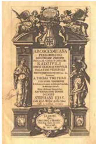
Jerosolimitana peregrinatio (címlap)