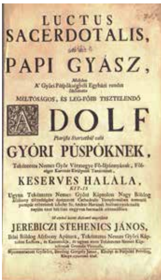
Stehenich János: Luctus sacerdotalis (címlap)