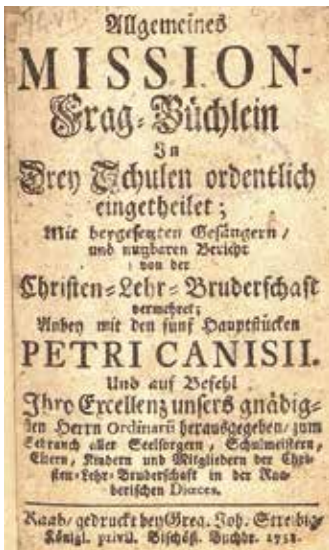
Allgemeines Mission-Frag-Büchlein (címlap)