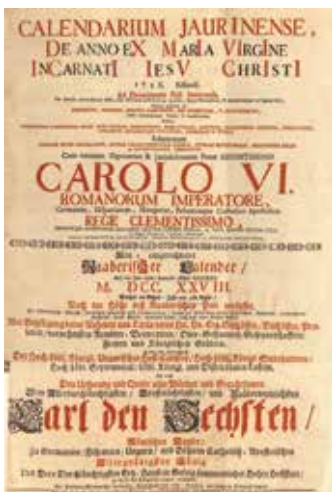
Calendarium Jaurinense ... 1728 (címlap)