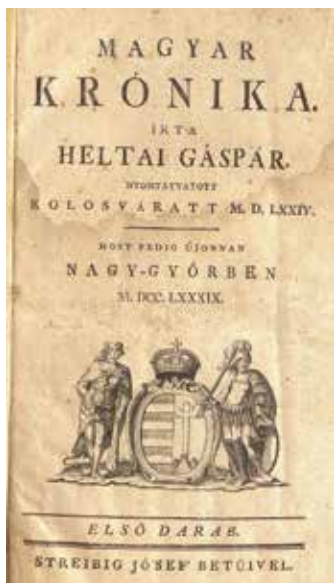
Heltai Gáspár: Magyar krónika (címlap)

A Streibig-nyomda 18. századi kiadványainak számát mind Borsa Gedeon, mind V. Ecsedy Judit mintegy ezer darabra becsülte; magam két évtizeddel ezelőtt 977 darabot tudtam összeszámolni. Érdeemes néhány pillantást vetnünk e kiadványok megoszlására!