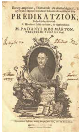
Padányi Bíró Márton: Ünnepp-napokon,... (címlap)