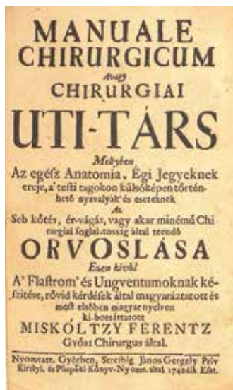
Miskolczy Ferenc: Manuale chirurgicum (címlap)

kellene számba vennem, melyek a tulajdonosváltások miatt együttesen 58-féle nevet viseltek... Így csupán vázlatos áttekintéssel szolgálhatok az alábbiakban.