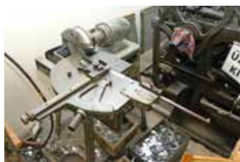
Az utolsó kézirat a linószedőn