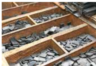
Az utókornak megőrzött kincsek

szánszát a műfaj. Egyes kereskedelmi taktikával kihasználta azt a technológiai sajátosságot, hogy a magasnymtatás, laikusok számára is felismerhető jellegzetességei, hamisítás elleni védelmi elemként adhatók el.