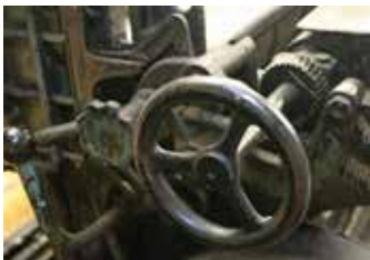
Az utolsó óráig dolgoztak a gépek

bek között a néhai Veszprémi Nyomdában focicsapatot szervezett, amiből az ofset-előkészítő lányok sem maradhattak ki köztük e sorok írójával.