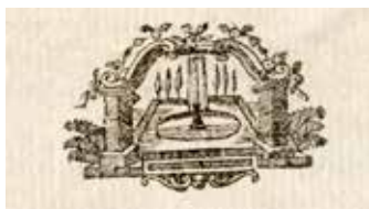
6. Szökőkutat ábrázoló dísz a Szent Péter és Pál napjára készült prédikációs-kötetből (1791)

A Számmer nyomdászcsalád a 19. századi magyarországi könyvkiadásban játszik ugyan jelentősebb szerepet, de legelső vállalkozásukat még a 18. század végén létesítették Veszprémbe. 2