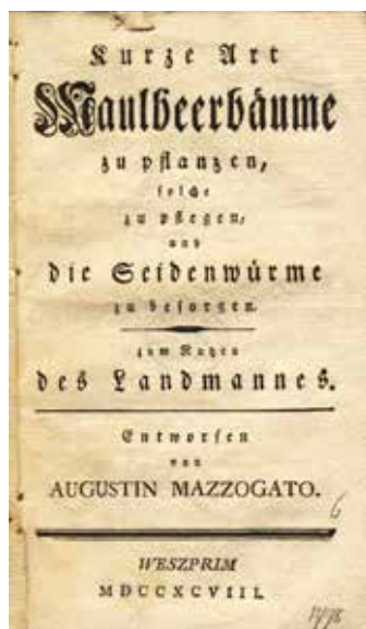
8. Német nyelvű könyv az eperfa és a selyemhernyó-tenyésztés népszerűsítésére

Veszprém azonban nem maradt nyomda nélkül, mert már 1838-ban megjelent egy kiadvány Jesztány Tóth Jánosnál (Számmer Alajos féle betűkkel). Ez a nyomda egy évtizedig működött, majd 1847-ben Ramasster Károly folytatta a veszprémi könyvnyomtatást. 4