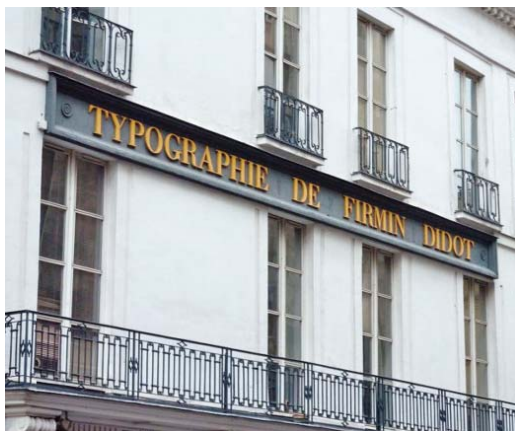
A Firmin Didot nyomda

♦ A textus , németesen text elnevezés talán még Gutenberg idejében keletkezhetett. A szó maga szöveget jelentett, és Gutenberg tényleg ilyen nagyságú betűkkel nyomtatta egyik bibliájának a szövegét.