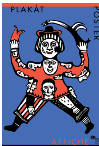
A Magyar Plakát Társaság számára készült munka, a bemutatkozó kiállításához (2005)