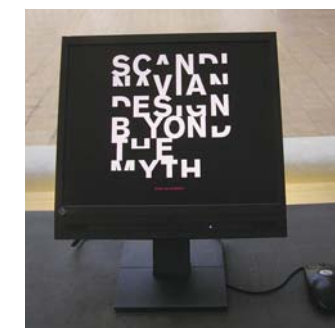
Nyitó- vagy zárókép. Képernyő és egér formaterve, és a program itt is „beyond the myth”